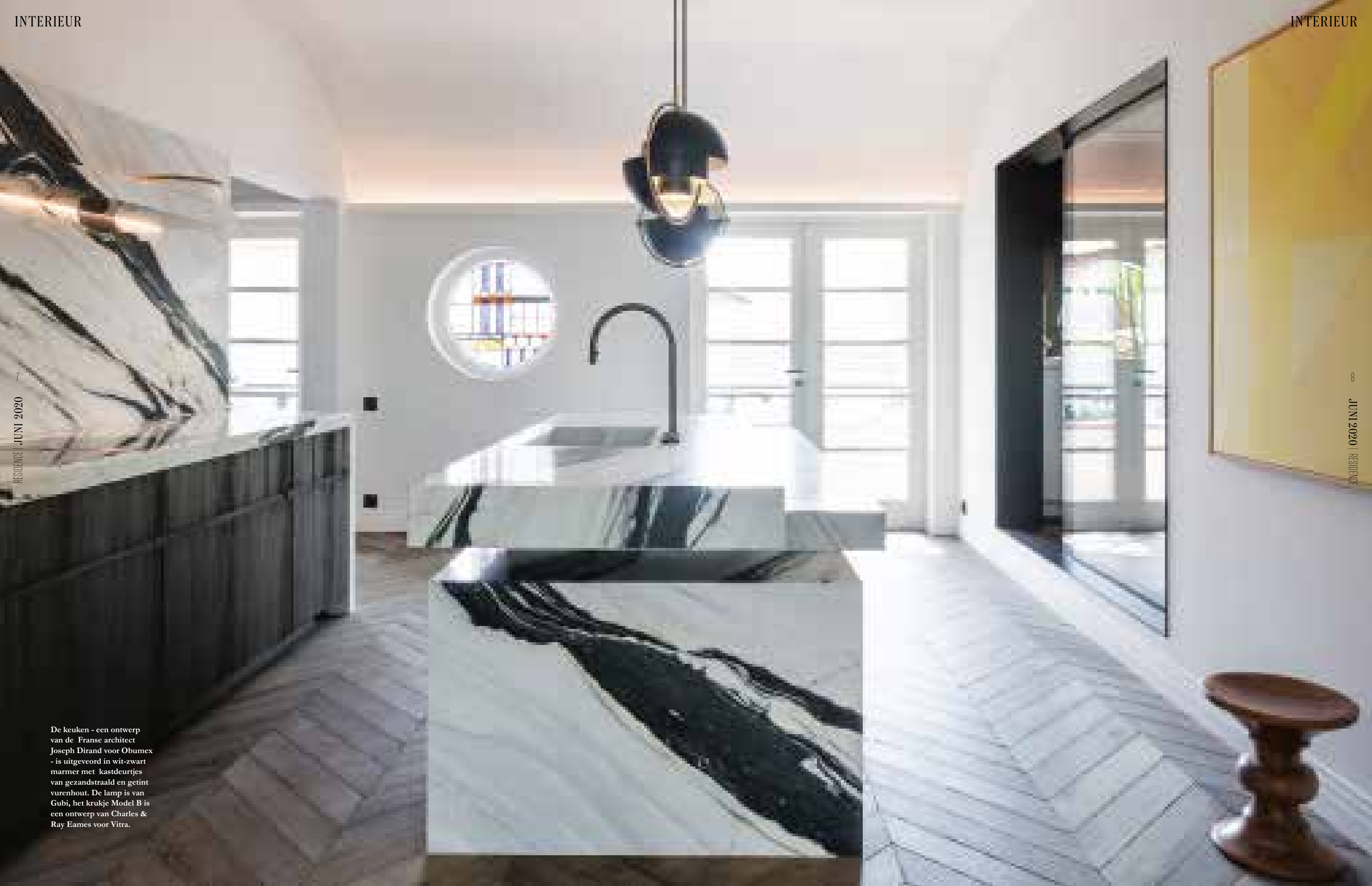
De keuken - een ontwerp van de Franse architect Joseph Dirand voor Obumex - is uitgevoerd in wit-zwart marmer met kastdeurtjes van gezandstraald en getint vurenhout. De lamp is van Gubi, het krukje Model B is een ontwerp van Charles & Ray Eames voor Vitra.