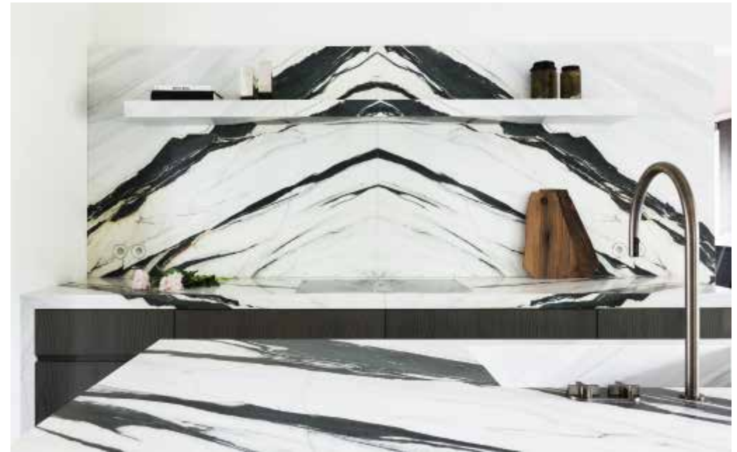
De achterwand van de keuken is door Obumex uitgevoerd als een kunstwerk in zwart-wit marmer.