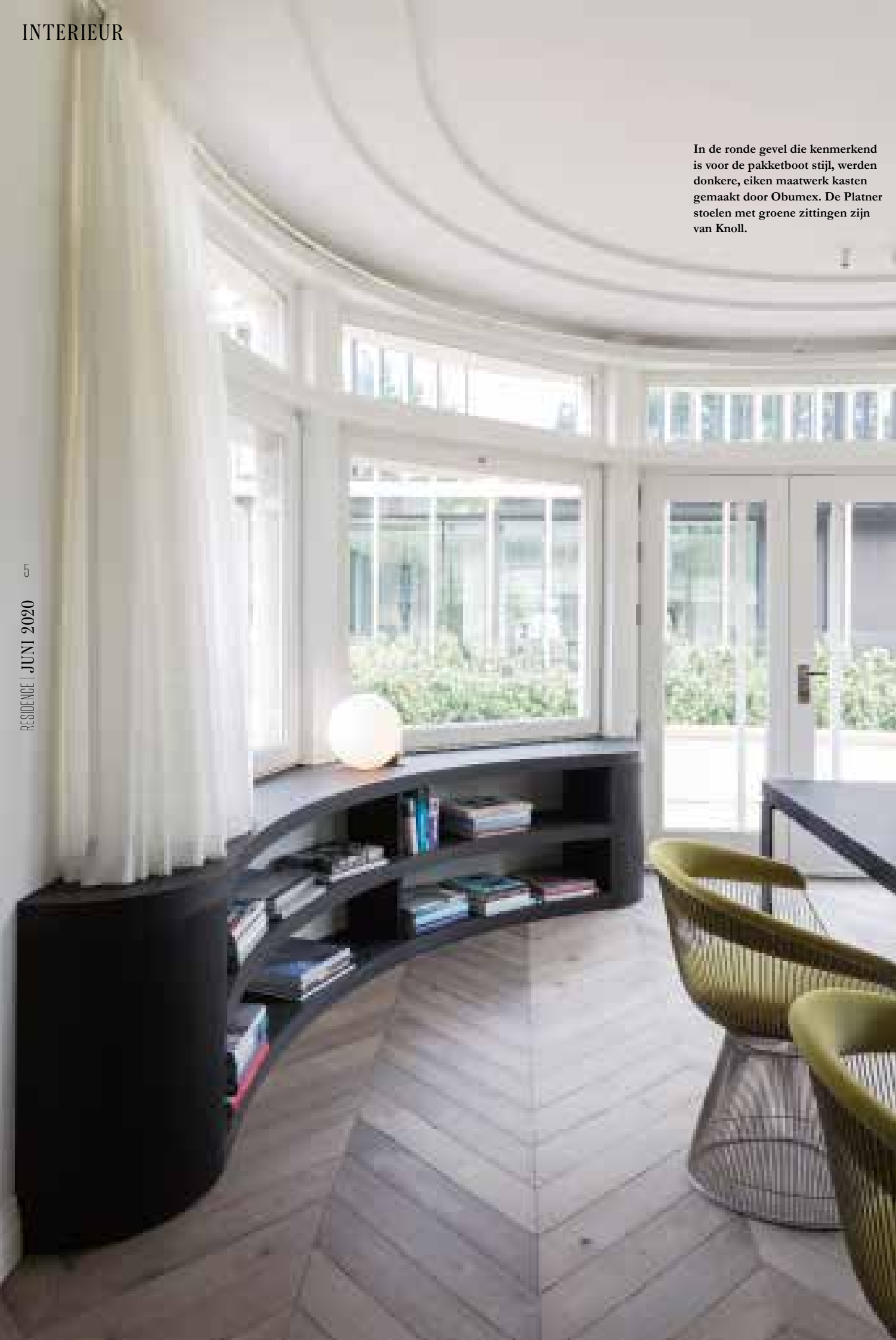
In de ronde gevel die kenmerkend is voor de pakketboot stijl, werden donkere, eiken maatwerk kasten gemaakt door Obumex. De Platner stoelen met groene zittingen zijn van Knoll.