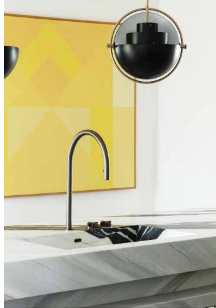
LINKS Het keukeneiland van Obumex heeft een zwevend blad. De Platner stoel is van Knoll.