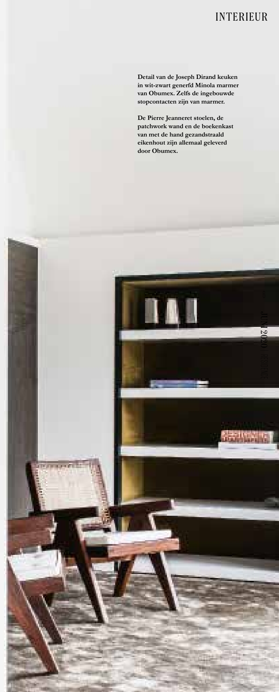
De Pierre Jeanneret stoelen, de patchwork wand en de boekenkast van met de hand gezandstraald eikenhout zijn allemaal geleverd door Obumex.