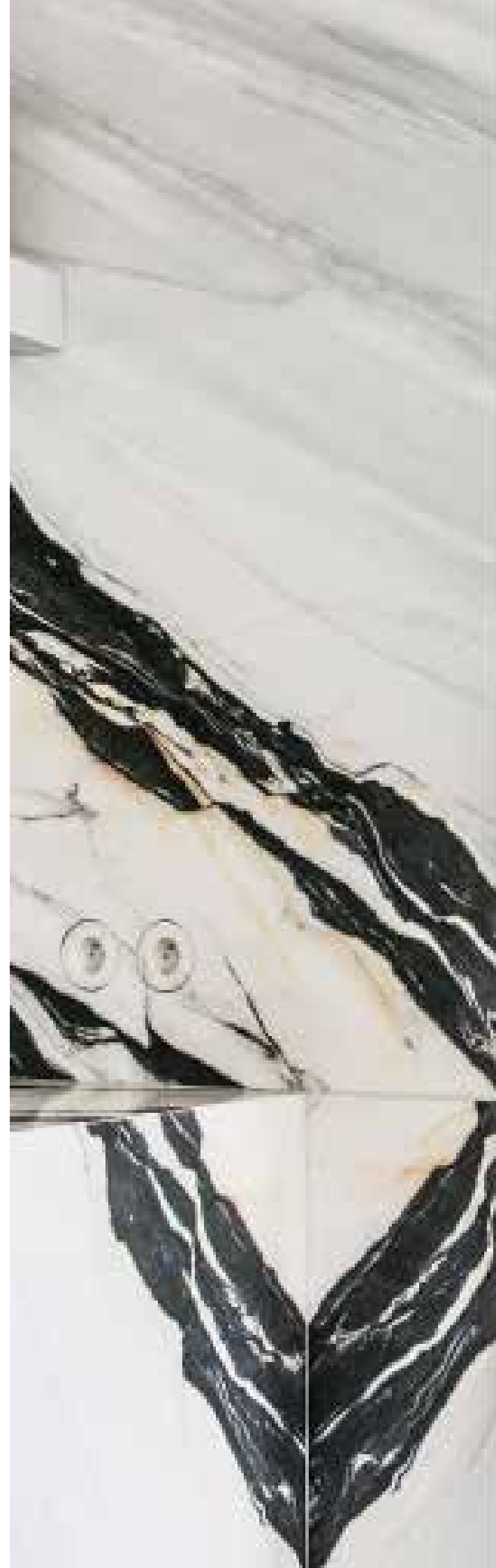
Detail van de Joseph Dirand keuken in wit-zwart generfd Minola marmer van Obumex. Zelfs de ingebouwde stopcontacten zijn van marmer.