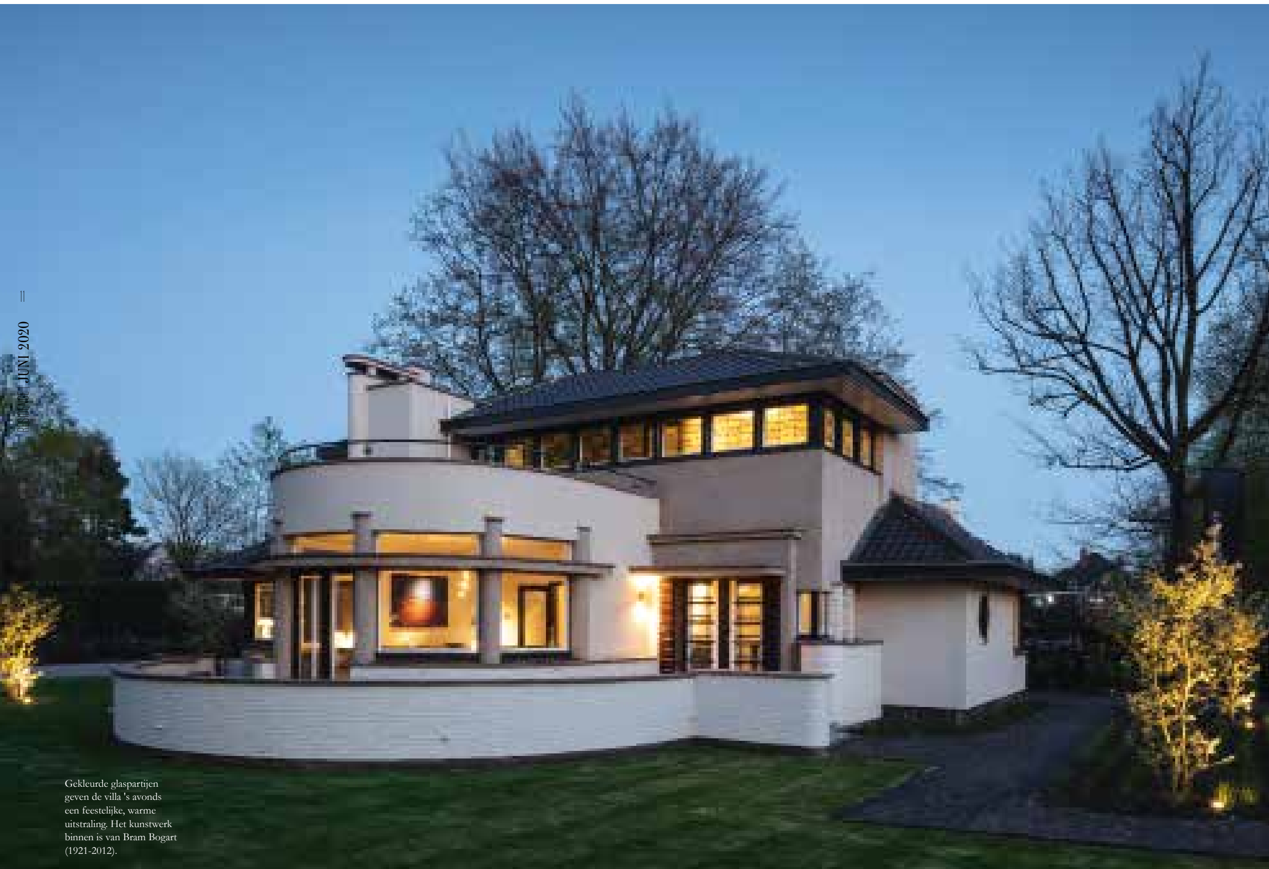
Gekleurde glaspartijen geven de villa 's avonds een feestelijke, warme uitstraling. Het kunstwerk binnen is van Bram Bogart (1921-2012).