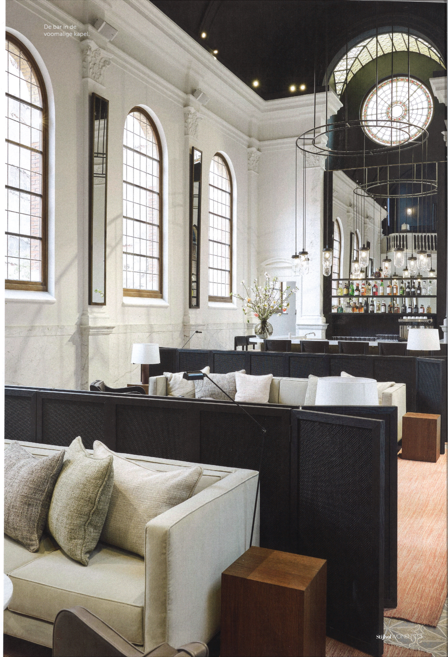
De bar in de voormalige kapel.

DEZE PLEK IS HEILZAAM VOOR LICHAAM EN GEEST