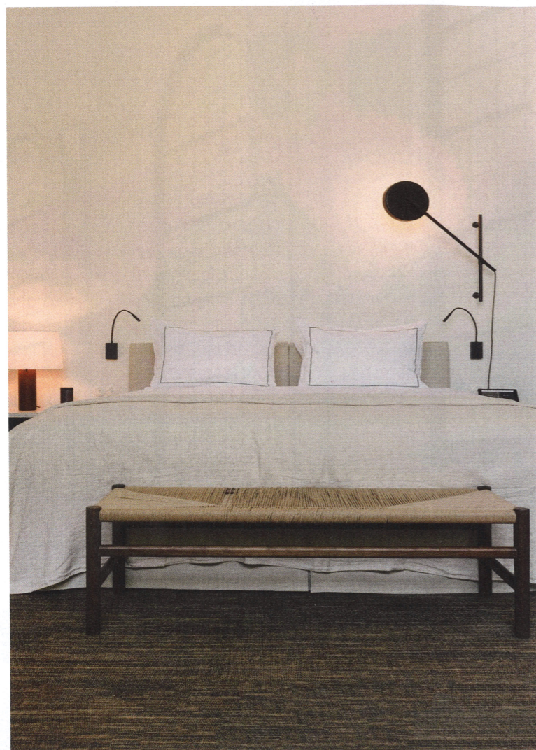
Het hotel telt negen verschillende kamertypes. Er zijn intieme kamers, suites met eigen woonkamer tot het grote atelier met bureau dat uitkijkt over de hele site. Overal is het evenwicht bewaard tussen verleden en heden. Voor de verlichting sprak Vincent Van Duysen zijn contacten aan bij Flos

HET INTERIEUR IS EEN EERBETOON AAN HET VOORMALIGE KLOOSTERLEVEN ZONDER HET HEDENDAAGS COMFORT UIT HET OOG TE VERLIEZEN