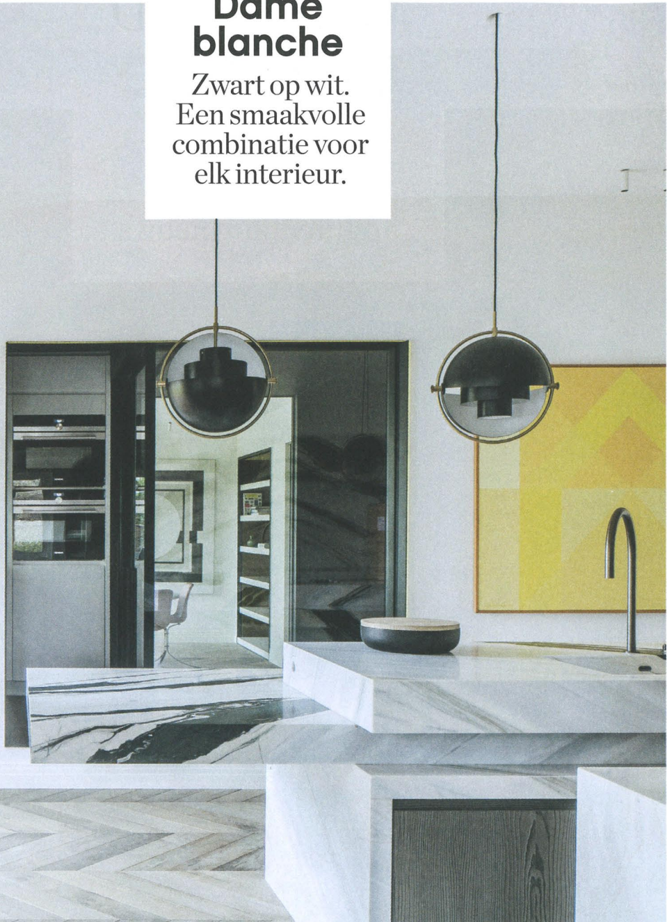
THOMAS DE BRUYNE / CAFEINE

Lees meer over dit volledige project in onze decospecial op 9 mei, rietveldprojects.be