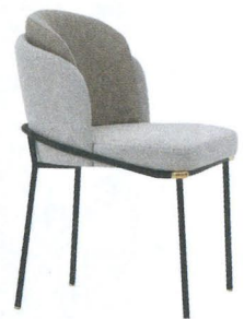
Armstoel Fil Noir, Christophe Delcourt voor Minotti, 2080 euro, minotti.com