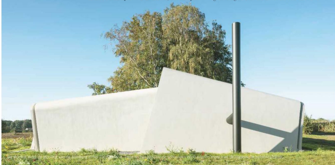
De woning volgt de glooiing van de Tomberg in het Pajottenland. Twee rechte losstaande schouwen contrasteren mooi met de organische betonsculptuur.

Die spanning tussen traditie en vooruitgang zit zelfs verrat in het panorama vanuit zijn schrijfkamer: zijn vroegere werkplek, het Kasteel van Gaasbeek, waar hij van 1954 tot 1963 conservator was. Het architecturale contrast kon niet groter. Het Kasteel van Gaasbeek is een onzuivere hybride van neobouwstijlen, Roelants eigen woning modernisme van het zuiverste kaliber. →